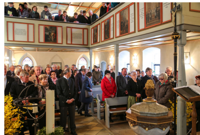
Goldene Konfirmation 2015

Am Sonntag, den 25. September 2022 feiern wir das Fest der Goldenen Konfirmation. Eingeladen sind ausnahmsweise sieben Konfirmationsjahrgänge, die in den Jahren 1965 - 1972 ihre Konfirmation hatten. Pandemiebedingt mussten wir das ursprünglich für 2020 geplante Fest um zwei Jahre verschieben. Wir hoffen in diesem Jahr auf einen Herbst, der einen Gottesdienst in der Steinheimer Niko-